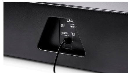
Connecteurs du panneau arrière / Version installation

Les caissons de grave ID S110 et ID S210 partagent la même réponse en phase que les autres enceintes NEXO. Il est donc très facile de les conjuguer aux autres enceintes de la série ID ainsi qu’aux autres systèmes NEXO.