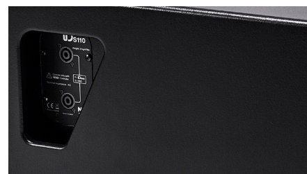
Connecteurs du panneau arrière / Version touring